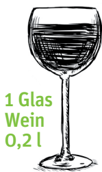
1 Glas Wein 0,2 l