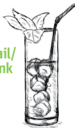
1 Cocktail/ Longdrink 0,3 l