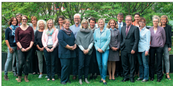
Gemeinsam für eine qualitätsgesicherte, transparente und vertrauliche Beratung: die Patientenberatungsstellen der ärztlichen Körperschaften Nordrhein-Westfalens.

Das Treffen wurde in diesem Jahr auch zu einem kritischen Dialog mit der Unabhängigen Patientenberatung Deutschlands