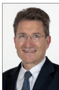
Professor Dr. Dr. Wolfgang Huber ist ehemaliger Ratsvorsitzender der Evangelischen Kirche in Deutschland.

In seinem Festvortrag spricht Professor Dr. Dr. Wolfgang Huber, von 2003 bis 2009 Ratsvorsitzender der Evangelischen Kirche in Deutschland, zum Spannungsfeld von ethischen Anforderungen an