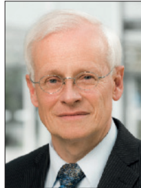
Vizepräsident Bernd Zimmer, Wuppertal