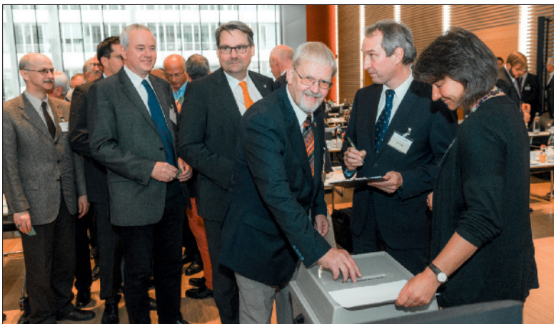
Die Kammerversammlung entschied in zahlreichen Wahlgängen über die personelle Besetzung der Gremien von Ärztekammer, Ärzteversorgung und Fortbildungsakademie.

Einstimmig wählte die Kammerversammlung in offener Abstimmung die Mitglieder des Finanzaus-