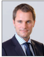
Neuer Bundesgesundheitsminister: Daniel Bahr (FDP)

Der Münsteraner FDP-Politiker Daniel Bahr (34) ist neuer Bundesgesundheitsminister. Er folgt auf Dr. Philipp Rösler, der das Wirtschaftsministerium übernommen hat. Bahr ist gelernter Bankkaufmann und studierter Volkswirt und war von 2009 bis zur Aufnahme des Ministeramts am 12. Mai Parlamentarischer