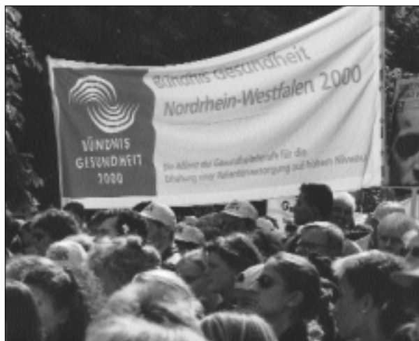
Zu der zentralen Kundgebung der Gesundheitsberufe waren zahlreiche Teilnehmer aus Nordrhein-Westfalen nach Berlin gekommen, allein rund 600 mit dem Sonderzug des „Bündnis Gesundheit NRW 2000“.

Aus dem Fenster im ersten Stock des Gebäudes der Kaiserin-Friedrich-Stiftung beobachtet Prof. Dr. Jörg-Dietrich Hoppe, wie sich der Platz füllt. Der Präsident der Bundesärztekammer und der Ärztekammer Nordrhein ist der Initiator des „Bündnis Gesundheit 2000“. Von einer gelungenen Demonstration in der Hauptstadt erhofft er sich